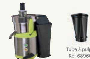
Tube à pulpe Réf 68960

Munie d'un tube d'évacuation de la pulpe, qui est directement rejetée dans un réceptacle placé sous le comptoir.