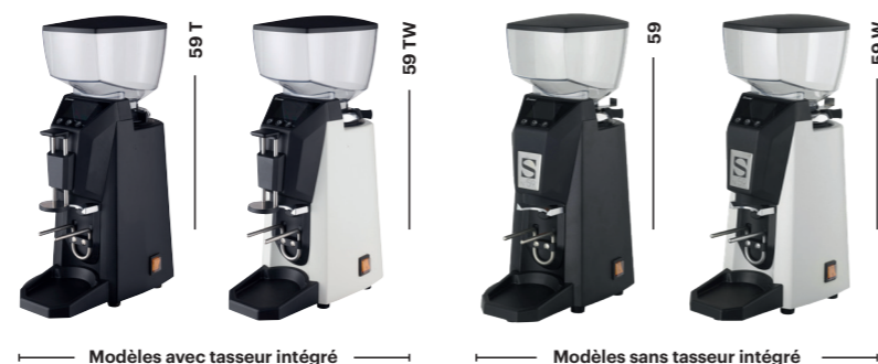
Modèles avec tasseur intégré